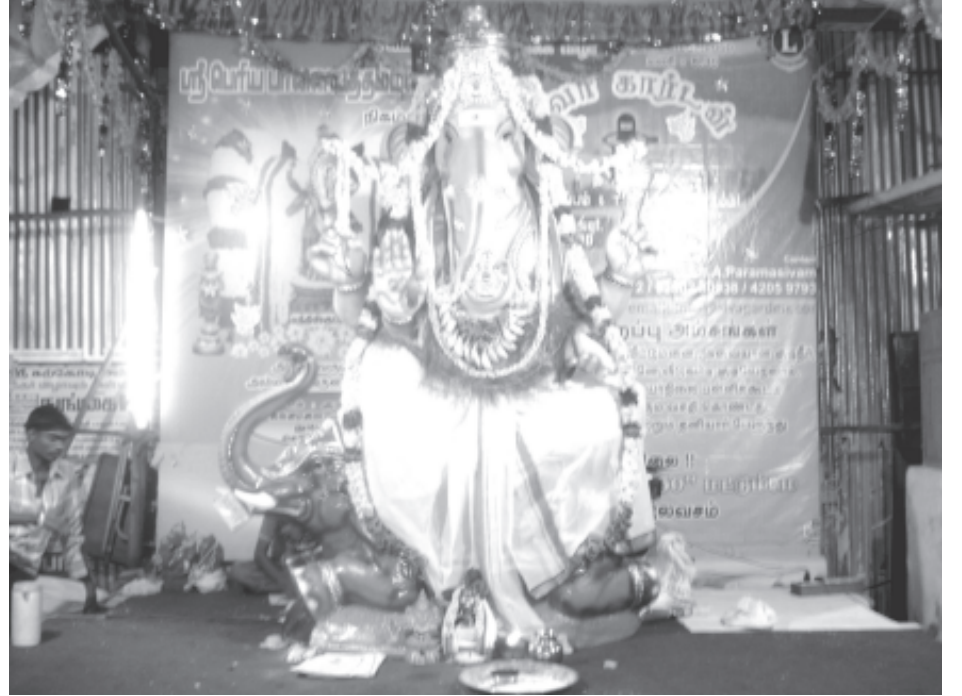
நுங்கம்பாக்கம் குமரப்பா தெருவில் குமரப்பா நண்பர்கள் சார்பில் வைக்கப்பட்டிருந்த ஸ்ரீபாலவிநாயகர் சிலை