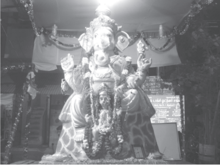
நுங்கம்பாக்கம் காவல்நிலையம் பின்புறம் ராமா தெருவில் வைக்கப்பட்டிருந்த விநாயகர் சிலை