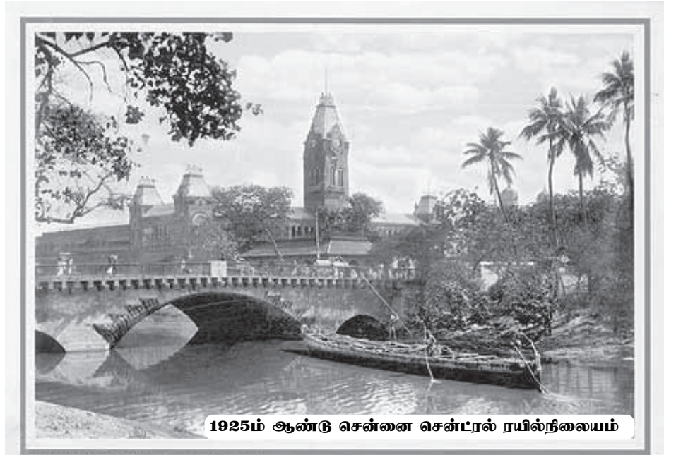
1925ம் ஆண்டு சென்னை சென்ட்ரல் ரயில்நிலையம்

சென்னை உருவாக்கப்பட்டு 370வது ஆண்டு நிறைவு நாள் 'சென்னை தினம் - 2009' என்ற பெயரில் 15 நாள் கொண்டாடப்படுகிறது.